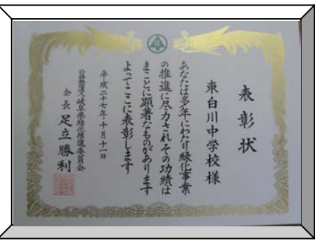
全国育樹祭（10/11）にて表彰

岐阜県PTA基金への寄付 ご協力をお願いします！ 県PTA連合会の活動（一人ひとりの子どもが心豊かで健康に育つ環境づくり）維持、充実のため、以下の物品のご提供（寄付）をお願いします。 未投函はがき、未使用切手、 図書カードや商品券等の未使用プリペイドカード お子さんを通じて担任に提出してください。