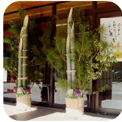
年末、PTA本部役員の皆様に立派な門松をつくっていただきました