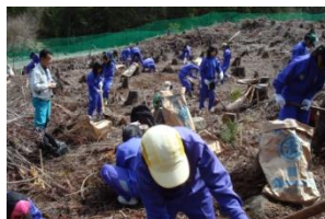
山の斜面を植林する