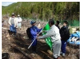
団長より団旗を授与される

1年生はこれから、源流調査や林業体験の活動を通して、先人が守り育ててきた「森林」という財産の素晴らしさを感じ、かけがえのない自然を大切にする心や、郷土を愛する心を培っていきます。