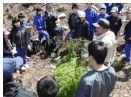
栗本さんからお話を聞く