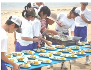
浜辺でバーベキュー