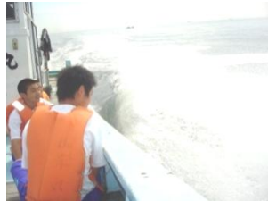
漁船でクルージング