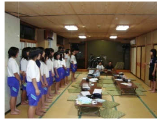
民宿の方とのふれあい