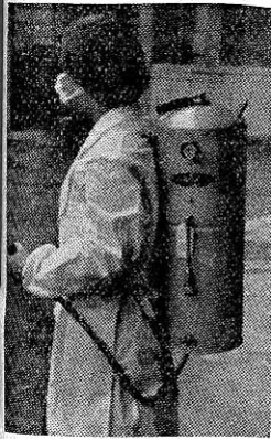
健康な生活は、先づ環境衛生の改善からをモットーに、カヤハエの駆除運力奉仕により、その効果をあげてい