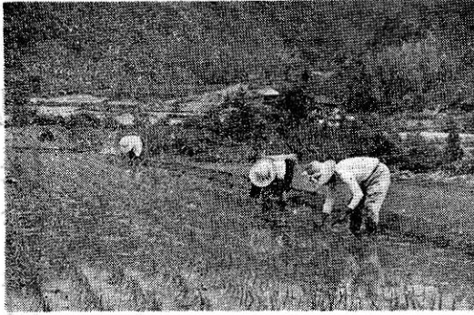
(写真は早くなつた田植—平高橋附近)

農家は今や猫の手も借り運動の一つとして行われてたいとの諺にもある農繁期にある協業化、協同化に右へ田植え、麦刈り、諸種苗のなえとして村内のあちこち植えつけ、手入れ等々……で農繁期の共同作業が行わそこで今日は最近全国的なれ、作業能率、主婦の食事準備の