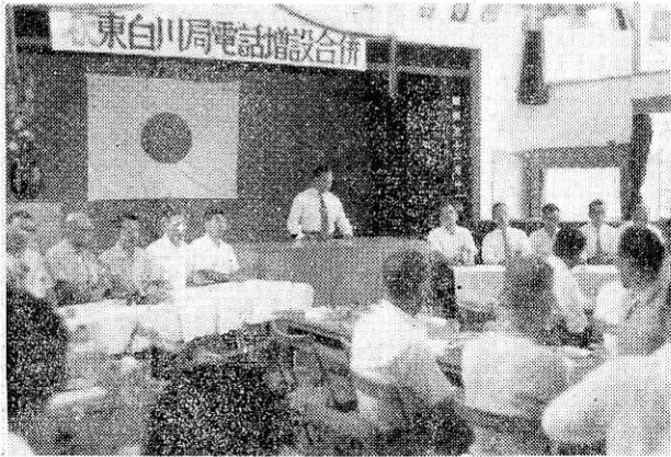
(写真は電話増設及び合併祝賀会)

白川局、美濃越原局合併祝賀を 賀会が関係者二百余名の出加え 席のもとに行われました。た全 遠くに離れて居ながら話村の ができる器械として我村本数 に初めて八本の電話が設とな 置されたのは昭和四年五月り、 一日、それ以来その電話の全部 普及は目ざましいものがあ落へ り、今年三月三十一日現在一本 東白川局五八本、美濃越原以上 局三一本となりましたが、の電 九百余戸の戸数から比較し話が て大衆の電話として程遠い入り ものがありました。それがこれ このほど電々公社に於て美 濃越原局と東白川局を合併の電 するのを機会に大はばに電話 話が増設され、全村二〇八利用