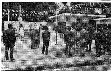
(写真はスタンド開所式)

かねて建設中であつた農協のガソリンスタンドは去る九月三十日関係者約七十名を招き完成式を行い新時代にマッチした取扱いを期すべく店開き致しました。 同スタンドは敷地約六三坪で十キロ(二万リットル)の地下タンクに計量器二基混合計量器一基、洗車及エヤー設備をし関係所管の検査も無事合格致しました。 今後は農業用燃料はもとより各車の給油に当つては危険物取締法に基いた完全な取扱いをするよう要望されています。