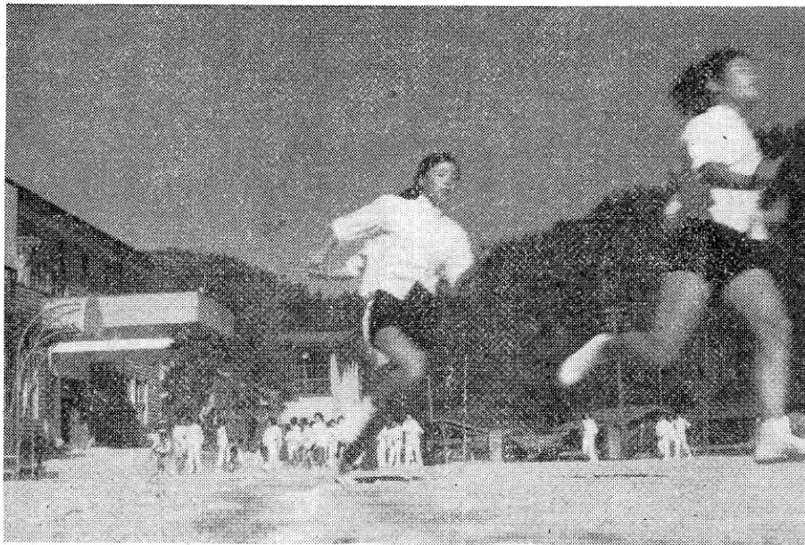
10月は「スポーツを楽しむ月」です