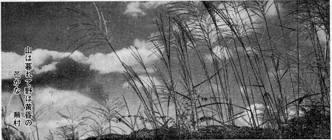
山は暮れて野は黄昏の 芒かな 蕪村

季節のはなし 9月のことを「長月」といいます。そのほか稲の熟れる月、稲刈る月ということから「熟月」「稲刈月」とも呼ばれます。