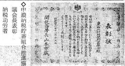
中濃納貯蓄組合推進協議会長表彰 納税功労者 越原 田口新太郎