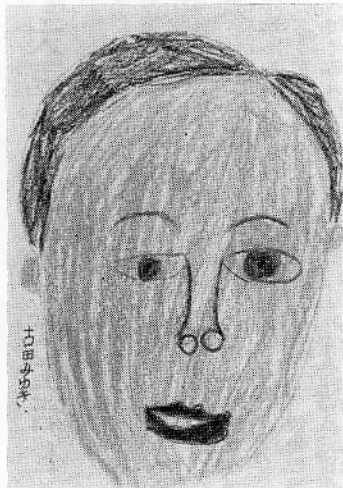
わたしのおとうさん

小さな村の小さな小中学校が、スポーツに、あるいは教育部門に都市部に負けない活躍をしていることは喜ばしいことといえます。ことしもまた、恵まれた自然と教育環境の中で、さまざまな分野での活躍が期待されます。