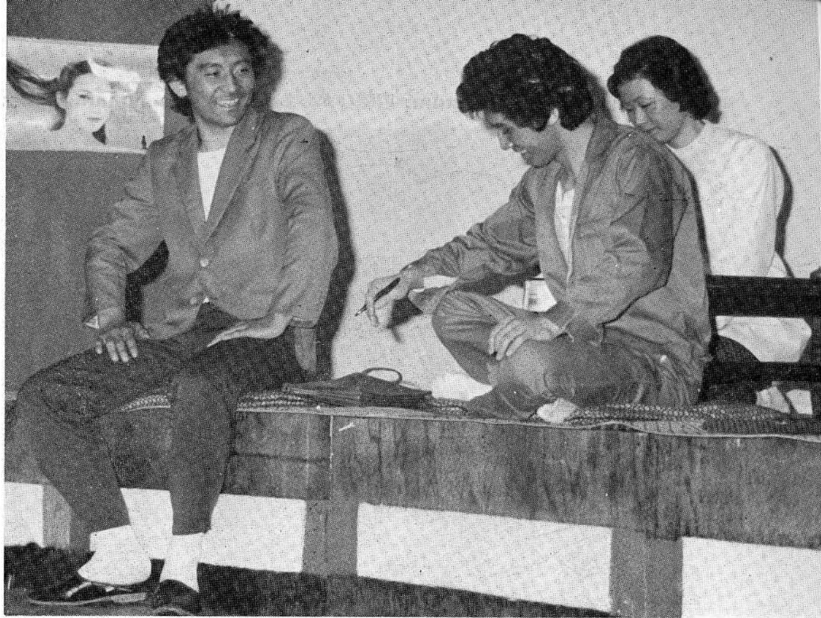
最優秀作品に選ばれた神土分団による「心郷」の熱演