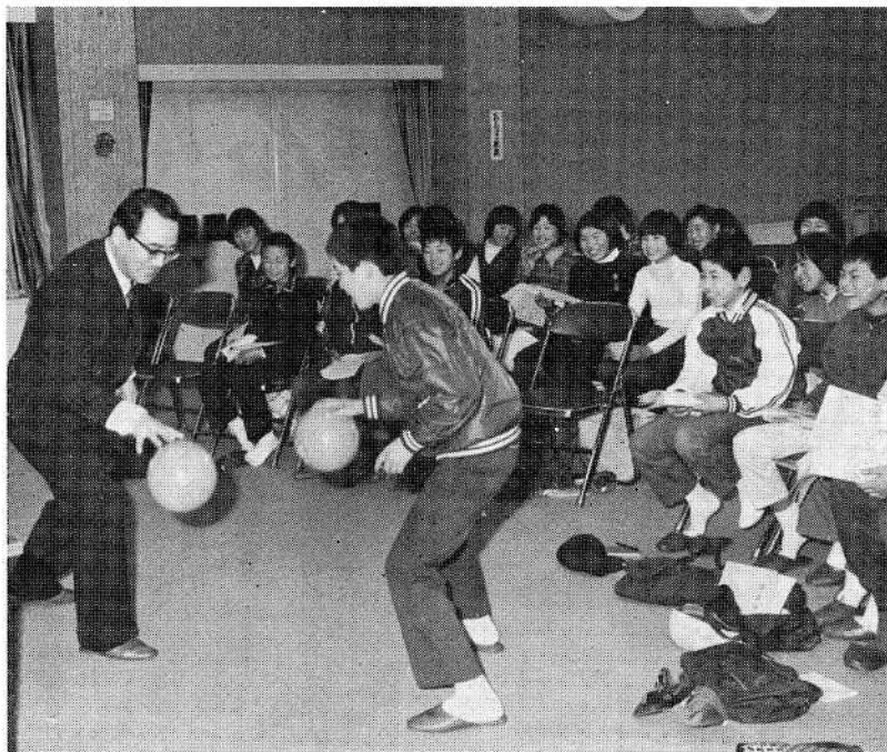
服部先生の指導を受ける子供たち