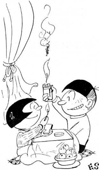
子どもの火遊びにご注意

次号では、有線番号簿から収録したおもな屋号(商店名となっている屋号は除く)を紹介いたします。