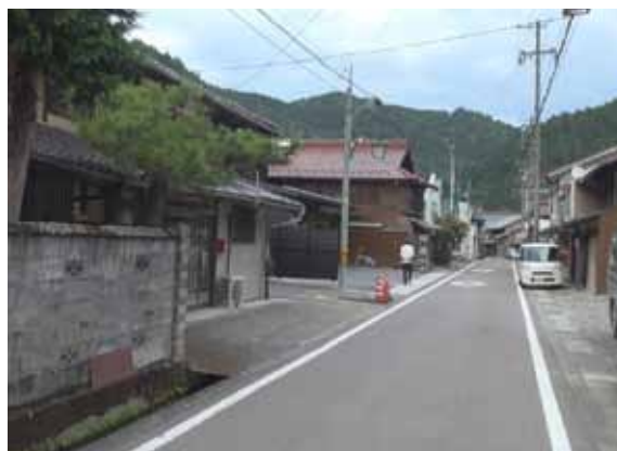
若松屋「前の店(=屋号)」から見つかった写真乾板(左)と同じ位置から撮影した現在の平地区の風景(右)。