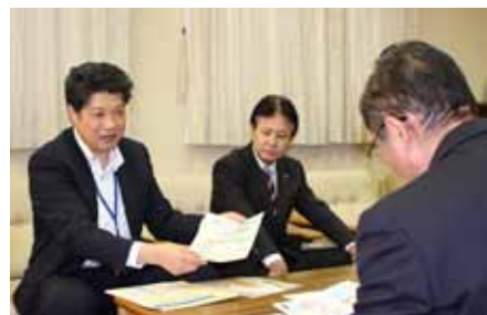
相続登記の推進のため役場を訪れた 岐阜地方務局・岡田治彦次長(左)

登記名義人が死亡しているにもかかわらず、相続登記が行われないまま放置され、権利の実態の把握が困難となります。 所有者の判明しない土地や建物(空家等含む)が増加すると、まちづくりのための公共事業を行う妨げとなったり空家問題を深刻化させてしまいます。 県では、「地方務局」「司法書士会」「土地家屋調査士会」が連携し、相続登記についてご相談に応じます。お気軽にお問合せ下さい。