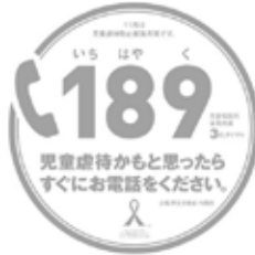
児童相談所全国共通 3桁ダイヤル

児童虐待による重大な事故が全国的に増えています。児童虐待は社会全体で解決すべき問題です。「児童虐待かも…」と思ったらすぐにお電話下さい。あなたの1本のお電話で救われる子どもがいます。 ★児童相談所につながります★ ※連絡者や内容等の秘密は守られます。