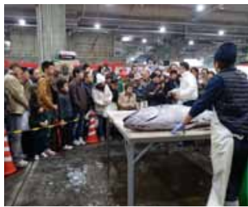
大人気! 「マグロの解体ショー」

今年も可茂公設市場の一般開放を行います。ぜひお越しください。 日時 十二月十一日(日) 午前七時～十一時 場所 可茂公設地方卸売市場 内容 マグロの解体ショーやせり売り、詰め放題など 駐車場 四〇〇台 問 可茂公設地方卸売市場 ☎0574・62・7711