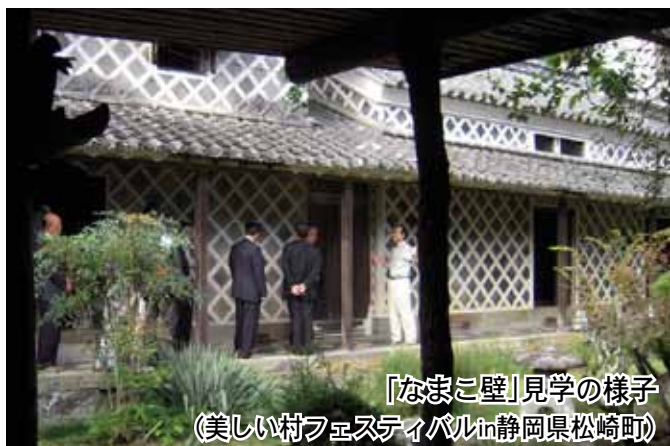
「なまこ壁」見学の様子 (美しい村フェスティバルin静岡県松崎町)

東白川村として目指す姿は、『経済的自立とそれに裏付けされた形で村としてその主人公である住民が美しい農村東白川村を誇りに思いながら幸せに暮らせることである』と考えております。