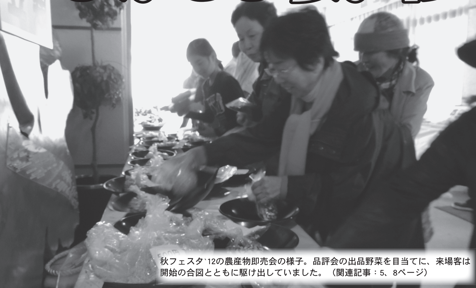
秋フェスタ'12の農産物即売会の様子。品評会の出品野菜を目当てに、来場客は開始の合図とともに駆け出していました。（関連記事：5、8ページ）