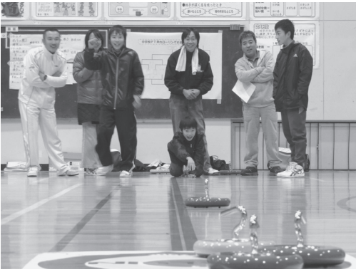
一投を見守る参加者

今回の交流会のほか、来年三月に教育委員会主催のカローリング体験会、村民カローリング大会が予定されており、様々な交流事業へ活用されています。