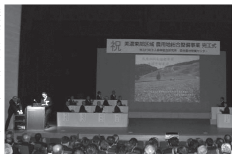
完工式での式典の様子

農業生産性向上を目的に、独立行政法人森林総合研究所が平成十年度から取り組んできた「美濃東部区域農用地総合整備事業」の完工式が、十一月二十七日郡上市総合文化センターで関係者約百五十人が集まり開催されました。