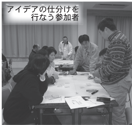
保護者の皆さんから意見をいただきました

また、策定した「美しい村東白川将来ビジョン」は、総合計画の骨子部分としていかしていく計画です。