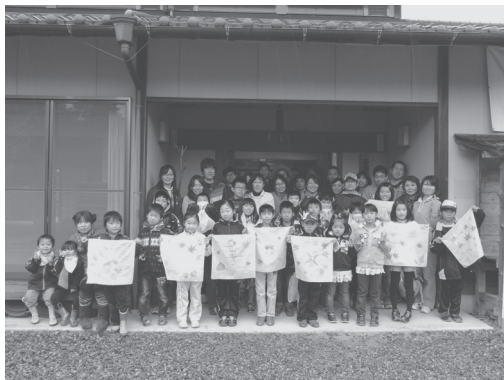
ツアー参加者のみなさん

最後に実施されたアンケートの回答では次回への参加希望が多く、自然を通じた家族の思い出づくりができた一日となったようです。