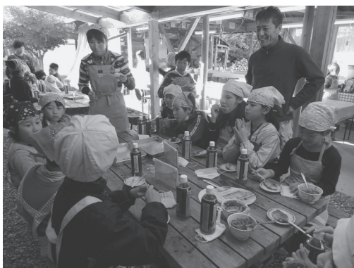
ともに五平餅を味わう児童

今年度も、八月には村の四年生の児童が桑名市へ赴きハマグリの放流や海の生き物の観察を行ないました。また十一月十日には、城東小の児童が来村し、こもれびの里で交流会が行なわれました。村の児童が水源地について学習した成果を発表したほか、五平餅づくり体験をともに楽しんで交流を深めていました。