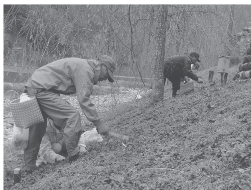
植栽をおこなう皆さん

十一月十一日、神土区と鮎ヶ瀬夢櫻の会は呼びかけに応じた村民とともに、平成橋からえん堤までの土手に約八千球の水仙の球根を植えました。