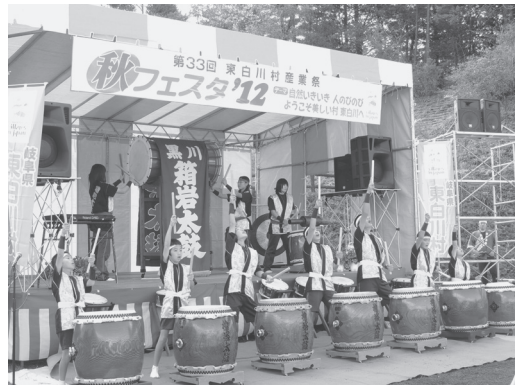
黒川の子どもたちによる箱岩太鼓