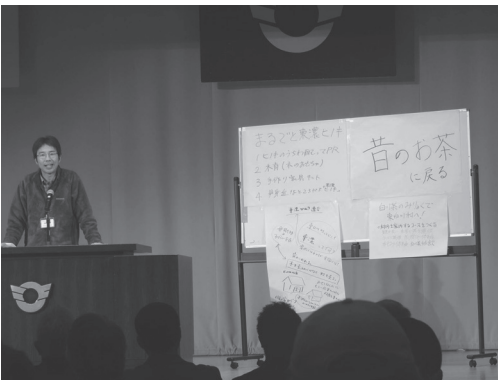
全体会での分科会報告 東濃ヒノキや白川茶への提案を紹介

大会には県内外のNPO法人、企業、行政関係者など百余名が参加、東白川村や関係団体・企業の取り組みを通じて意見を交わした三つの分科会の発表を基に「人々が訪れたい山村」の魅力と可能性について議論していました。