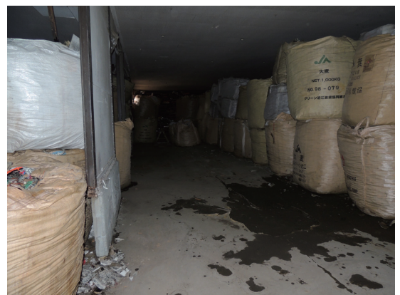
保管されている廃棄物