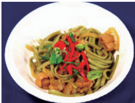
飛騨牛ホル焼茶うどん (300円)