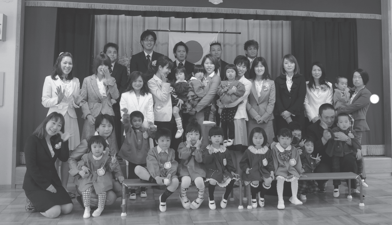
○4月5日、みつば保育園に入園したもも組と保護者の皆さん