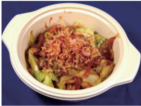
白草の鶏ちゃん焼うどん (300円)