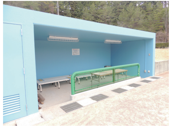
改修されたダッグアウト

は、「お茶の産地で育ってきたが、このような機会は初めてで勉強になった。今後に役立てたい。」と話していました。