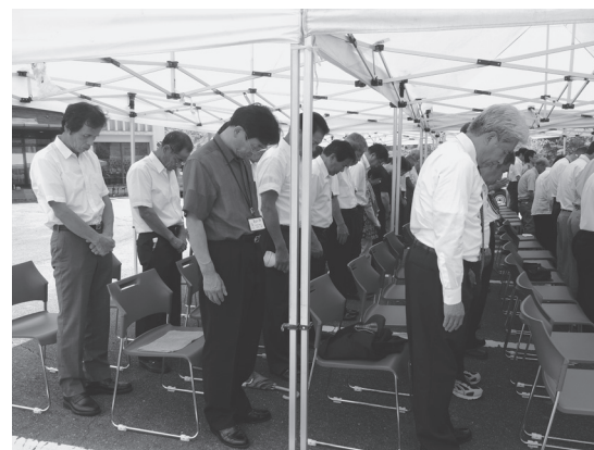
黙とうを捧げる参加者