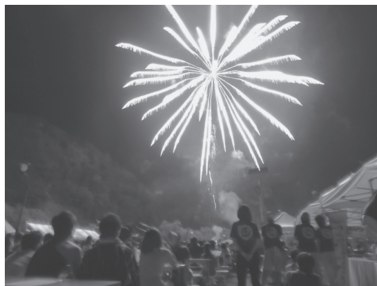
迫力の打ち上げ花火

見られました。イベントも盆踊りや千五百発の打ち上げ花火など最後まで充実した内容で、会場は終始活気に包まれていました。