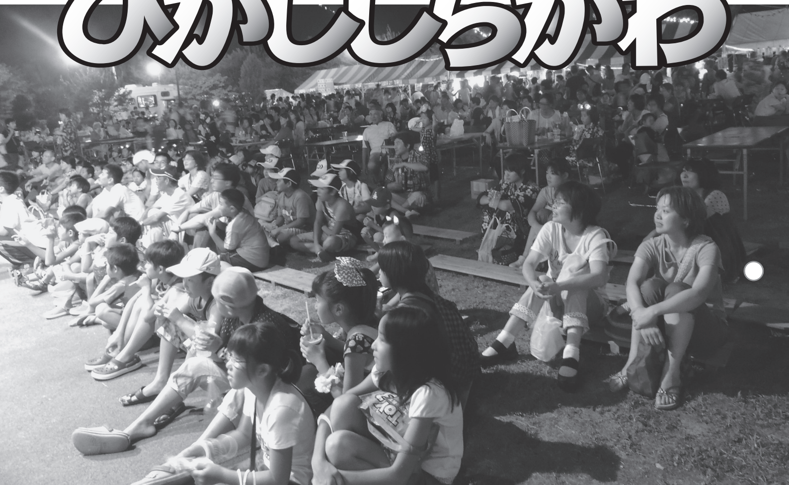
○8月14日、東白川村夏祭り会場の様子。(関連4ページ)