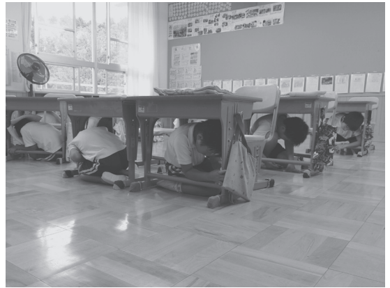
机の下で身を守る児童

またこの日の宿題として「家族で避難所への行き方や、近所の危険い所はどこかなど、相談してみてください。」と話されました。