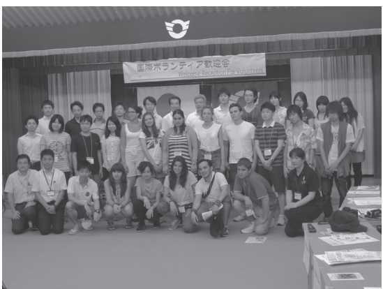
国際ボランティアと名古屋商科大学の皆さん

そのほか、今年は美濃加茂市のポート競技への出場や高山市への視察研修といった村外での活動や、歌舞伎練習見学や盆踊り教室への参加、水墨画体験など、日本や村の伝統文化に触れる活動などにも参加していました。