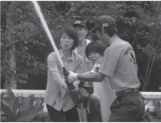
消火栓取り扱い訓練

この訓練では、南海トラフ地震発生を想定。発生が予想されている地震に向けた、村全体で防災の備えを確認しました。