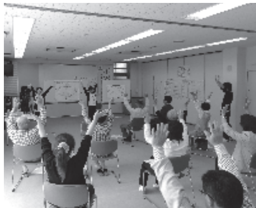
予防体操を行う参加者

看護師・保健師を目指している岐阜医療科学大学の学生五名が、五月十二日から二十九日までの間、保健福祉センターで実習を行いました。