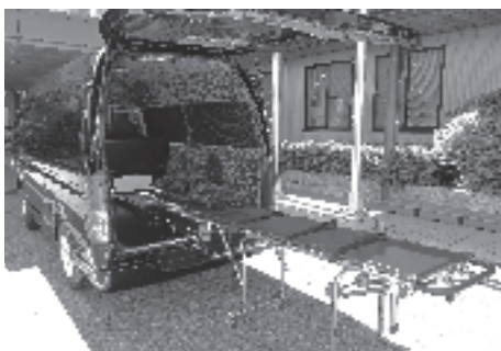
新しい霊柩車とストレッチャー

7月 日 曜日 加茂医師会 午前9時～午後5時 6 日 岩永耳鼻咽喉科 (美濃加茂市 / 25-8749) 13 日 堀部医院 (美濃加茂市 / 25-2910) 20 日 木沢記念病院 (美濃加茂市 / 25-2181) 21 日 太田メディカルクリニック (美濃加茂市 / 26-2220) 27 日 木沢記念病院 (美濃加茂市 / 25-2181)