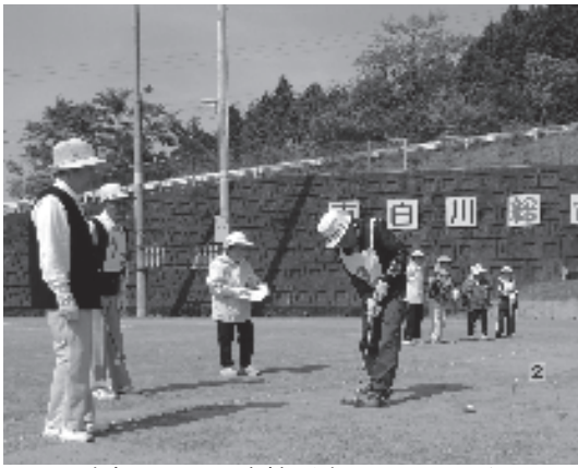
試合になると表情が変わる選手たち

夏のような強い日差しの中、選手同士声をかけ合い、指示を出し合い、暑さに負けない熱気ある大会になりました。