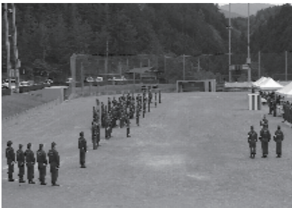
厳かに行われた開会式

なお、小型動力ポンプの部で優勝した第四部は、村の代表として六月二十二日に七宗町で開かれる郡大会に出場。本村の小型動力ポンプの部、三連覇が懸かっており、第四部の団員はこれを目指し、残りの約一週間、他の部も協力しながら訓練に励みます。