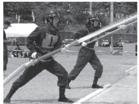
練習の成果を披露しました