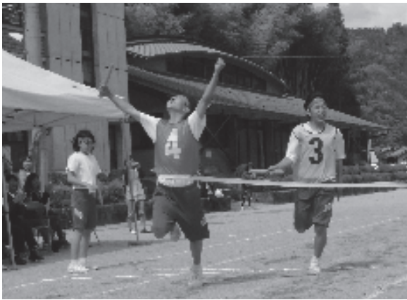
アンカー勝負で競り勝った三年生

大会は三年生が総合優勝しましたが、学級対抗種目では二年生や一年生が勝ったものもあり、各学年の強い結束が感じられました。