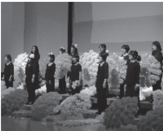
合唱には華やかな演出も