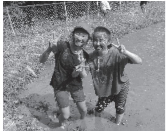
泥パックでお肌ツルツル！？

小学5年生は総合的な学習の時間で米作りを行っており、五月八日には小学校の学習田で自分の手足を使って代掻きをしました。田植えや稲刈りを実施する小学校はありますが、代掻きを行うところはあまりありません。