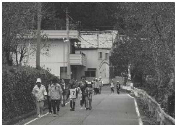
色づき始めた紅葉を楽しむ

東白川村いきいきウォーキング大会が十月二十六日に行われ、村内外から七十五人が参加しました。