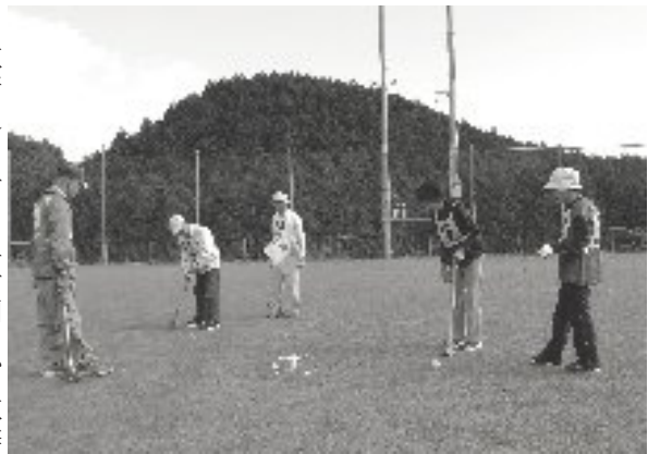
和やかな雰囲気の中にも真剣なプレー