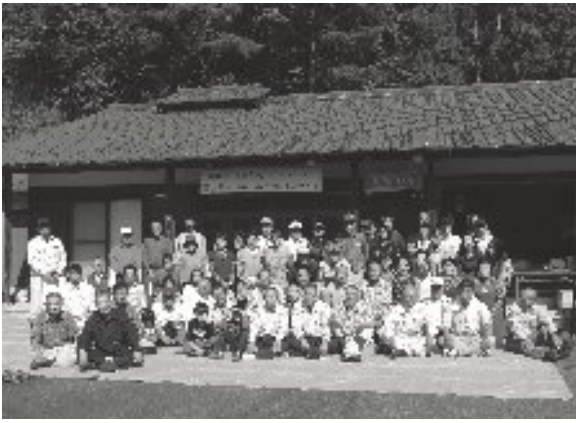
親田会館で記念撮影

合併により七十七戸となった親田自治会は、より一層の団結と協力で安全安心、住みやすい地域づくりを進めます。