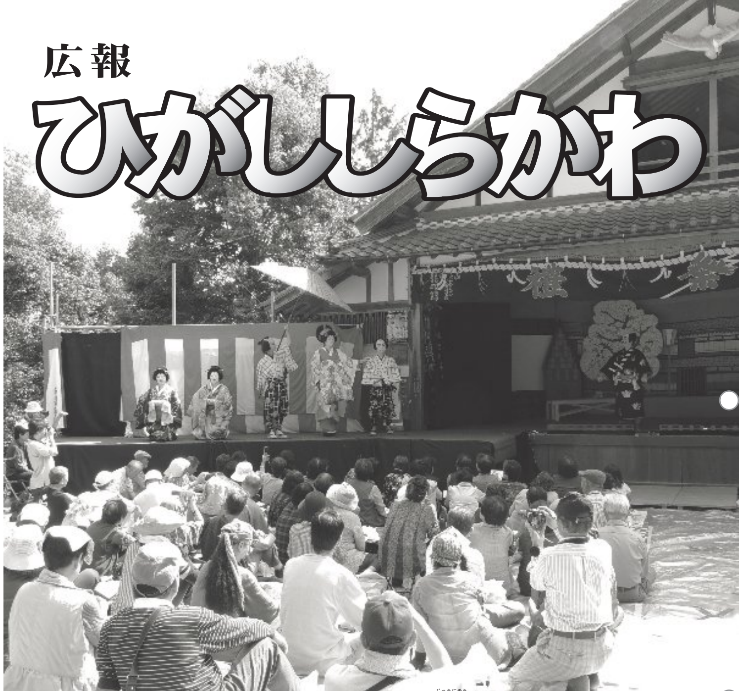
10月11日、坂祝町十二社神社の農村舞台上で上演された東白川村の地歌舞伎