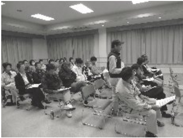
参加者は日頃の思いを行政に伝える

です。昨年度は茶業をやめる方が十名程度おり、後継できる若い方を雇用し定住させたいです。集落営農が進んでいるが、茶業もその方策を求めています。