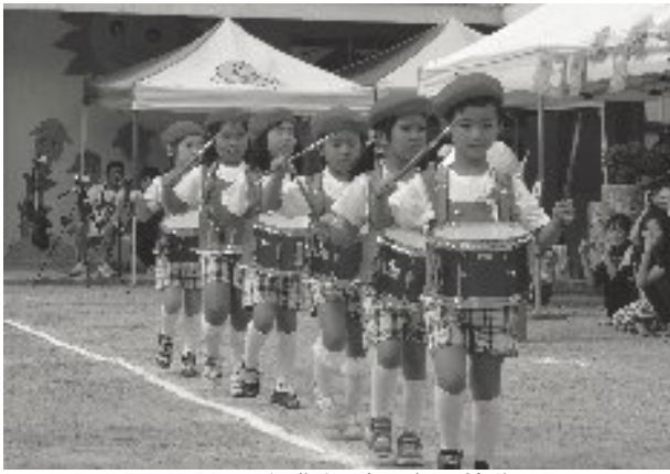
きれいに行進する年長組の鼓隊