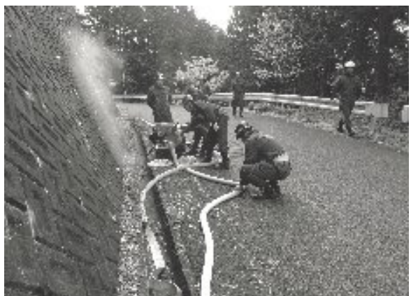
各部が協力してホースをつなぎます