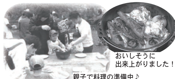
親子で料理の準備中♪

この体験塾は、自然の中で親子の絆を深めることを目的に毎年行われています。この日はお茶の火入れ体験やダッチオーブンを使ったアウトドア料理、木工体験などを行いました。