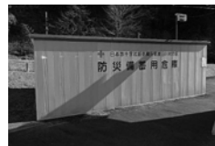
防災センター(平)に設置された防災備蓄倉庫

倉庫の中には水や食料、毛布、懐中電灯、バケツなど約80種類の物品を調達する予定です。