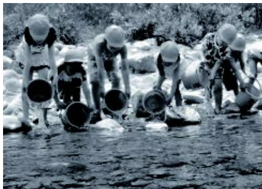
元気に川を泳いでいく姿を見届けました