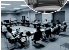
自主防災会長会議で防災行政無線の使い方を説明