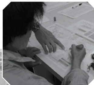
自宅周辺の危険個所や安全な避難路を確認

今月五日、土砂災害に対する避難体制の強化と防災意識の向上を目的に住民参加型の「東白川村防災図上訓練（避難経路確認）」が行われました。訓練では、ハザードマップで危険個所を把握し、避難所までの安全な経路を確認しました。最後に自主防災会長が実際に防災行政無線を使っ役場へ報告を行いました。