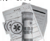
救急医療情報キット

また、救急医療情報キットを各家庭の冷蔵庫に保管してもらい、救助時に緊急連絡先や服用薬を把握します。