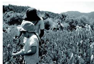
親子で初めてのお茶摘み

5月の終わり、街からのお客様をお迎えして、茶摘み&茶作り体験のイベントを開催しました。初夏を思わせる太陽の強い日差しを受けながら、参加者のみなさんは我を忘れて茶の葉を摘まれました。