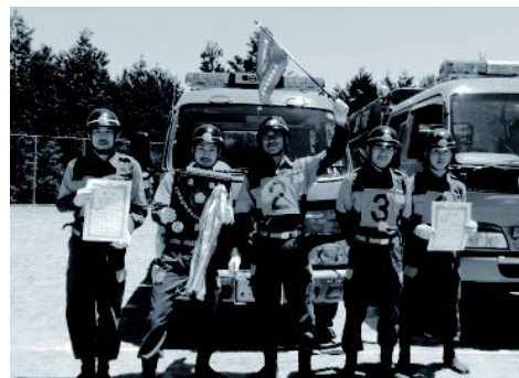
消防ポンプ自動車の部で優勝した第3部