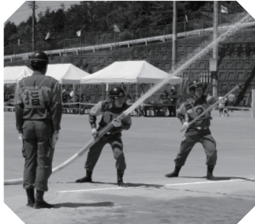
村消防操法大会の様子

現在、東白川村消防団には百十七名の方が在籍しています。村の消防団員の適正人数は百五十名とされており、団員の減少による防災力の低下が懸念されます。住み慣れた村や地域の方々に災害から守るため、消防団活動に理解と協力をお願いします。