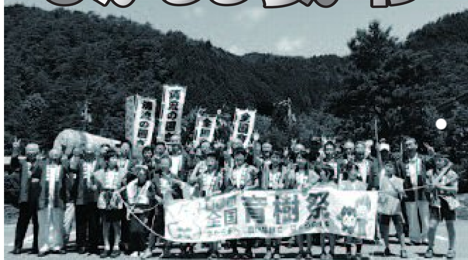
「100年の森づくりリレー」引継ぎ式(関連6ページ)