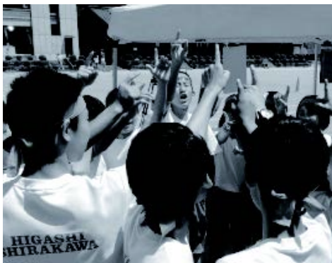
ムカデ競走を前に気合を入れる3年生

三〇度を超える暑さの中、中学校で体育大会が行われ、学年対抗で得点を競いました。 『向進く史上最高の仲間と共に』をスローガンに、競技の準備や片付けなどは生徒が中心となつて大会を作り上げました。 団体競技のムカデ競走では、三年生が歴代最速の二八秒〇一を記録するなど、六個の記録を更新しました。そして総合優勝は三年生に決まり、悔しい思いをした一、二年生は来年こそ！と気持ちを新たにしました。 それぞれが力を出し切った体育大会。全員が一丸となつて競技に取り組むことで協調性を養い、これからの生活に生かしていきます。