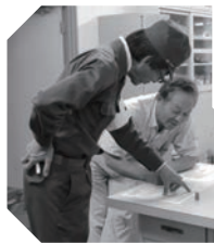
防災図上訓練の様子

東白川村は、土砂災害や地震が起こる可能性が十分にありません。人間は物事を自分に都合よく考える生き物です。今まで大丈夫だったんやで、これからも大丈夫」は災害には通用しません。「自分の身は自分で守る」「地域の安全は地域住民で守る」という自助・共助の気持ちで、普段から防災について考える機会を持ちましょう。