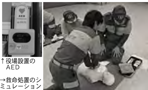
↑役場設置のAED →救命処置のシミュレーション ＜AED村内設置場所＞ 役場、はなのき会館、防災センター、小学校、中学校、保育園、総合運動場、保健福祉センター、道の駅、むくハウス、白川茶屋