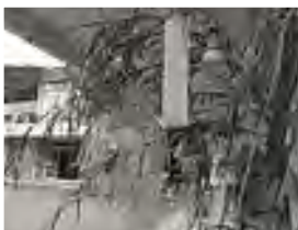
七夕の笹飾り(みつば保育園)

七夕は笹に短冊を付けてお願いをする日というイメージですが、お祝いの始まりは子どもの成長を願う節句のひとつです。▼もともと七夕の行事は旧暦の七月七日でこの日を「伝統的七夕」と呼んでいます。▼今年の伝統的七夕は八月二十日。梅雨明け後で晴天率が高く、月は夜半前に沈むので天の川がくつきりと見え、観測条件がそろっています。明かりを消して暗い夜空に光る星と天の川を楽しんでみてはいかがでしょう。▼日本には様々な行事がありますが、由来や本来の意味から離れて理解されている行事も多くあります。夏休み中やちよつとした空き時間に調べてみる面白くないでしょうか。(T)