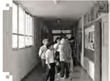
久しぶりに訪れた学校を楽しんだ

六十五歳以上の方を対象にしたリハビリ教室が行われ、二十一人が小学校を訪問しました。これは、介護予防事業のひとつで、人の交流をはかり閉じこもりを予防するために年間を通じて行われています。この日は、六年生が校内を案内しました。六年生は総合学習で福祉について学んでいることから、今回の訪問が実現しました。最初はお互いに硬い表情をしていましたが、校内を回るとちに次第に打ち解け、笑顔を見せました。