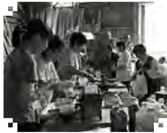
およそ60人が集まり楽しんだ