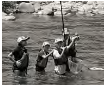
初めての友釣り。釣ったど〜!!