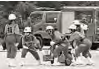
→七宗町女性消防隊による操法