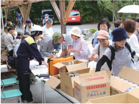
避難場所へ集まる住民ら＝西洞地区