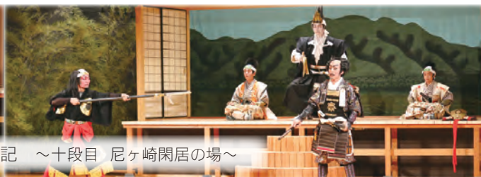
絵本太功記 ～十段目 尼ヶ崎閑居の場～