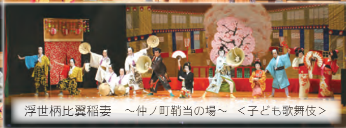
浮世柄比翼稲妻 ～仲ノ町鞘当の場～ <子ども歌舞伎>