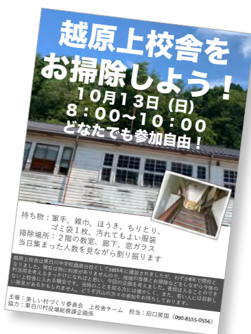
▲ 新聞折り込みチラシ

今回の企画は、現在は特に決められた利用目的がないこの建物を地域の皆様と一緒に掃除することでもう一度愛着を持っていただき、今後の利活用を考えるきっかけになればと思い計画しました。当時のことを知る方には懐かしく、若い人には目新しい発見があるかもしれません。多くの方が関わることで人が行き交う場となり、ゆくゆくは地域のシンボルとなってほしいなど期待しています。今後も継続していきたいと考えています。どうぞ沢山の方々の参加をお待ちしております。(田口房国)