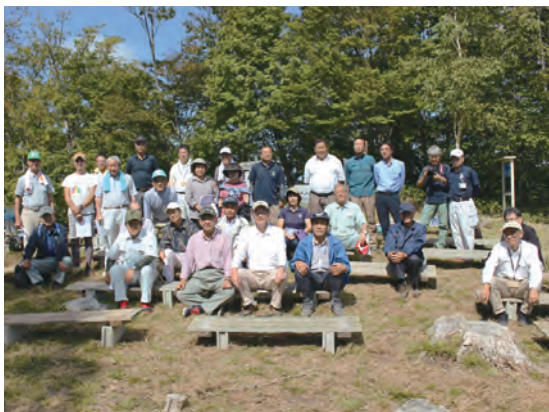
3市町村長と関係者らによる集合写真