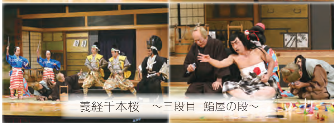
義経千本桜 ～三段目 鮎屋の段～