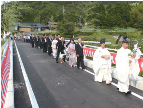
新しくなった「山元橋」を全員で渡り初め