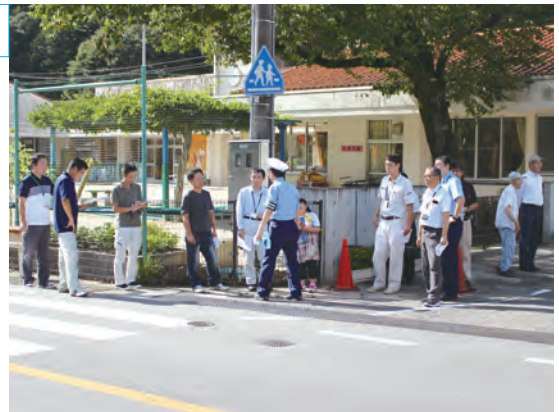
関係者らによる現地視察＝みつば保育園前

平成26年に制定された「東白川村通学路交通安全プログラム」の更新のため、行政機関や教育関係者など15名が集まり、通学路の安全対策の見直しなどについて協議しました。制定から5年が経過し、危険箇所については随時安全対策が講じられ解消しつつある状況で、会議では新たな危険箇所も含めた総点検を行いました。現地視察では村内4箇所を周り、現状把握と再点検を行いました。今後も定期的な地区点検を行っていく予定で、関係機関と連携しながら通学路の安全対策を図っていきます。