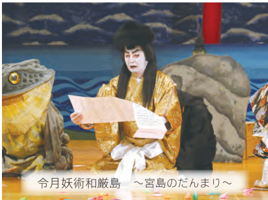
令月妖術和巖島 ～宮島のだんまり～