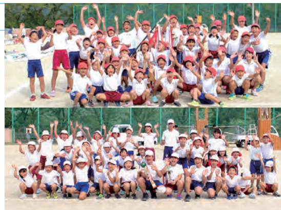
優勝した赤団(上)、健闘した白団(下)

天候に恵まれ、多くの保護者や関係者が見守る中、全校児童80人による運動会が行われました。全15種目のうち赤団と白団に分かれた応援合戦では、審査員から「どちらも素晴らしく甲乙つけがたい」と評価され、団結賞は引き分けとなり、大きな声でまとめ上げた赤団が大声賞を、連携した踊りを取り入れ観客を楽しませた白団がアイデア賞を獲得しました。総合結果は赤団が見事に優勝旗を勝ち取りましたが、一方の白団も最後まで団結力をみせ、全員が全力を出し切った大会となりました。