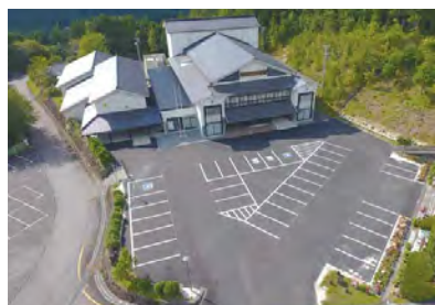
▲ 整備されたはなのき会館

はなのき会館の整備事業も 3 期目が完成し、今年度 8 月末で駐車場や屋根の修繕を行い 4 年かけた事業が完成いたしました。