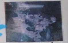
土地改良前 中谷航空写真 ~ 段々畑 ~