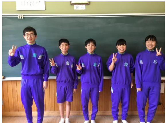
＜前期生徒会執行部＞

さて、コロナウイルスの影響で満足に生徒会活動ができない中ではありましたが、うれしい姿がありました。それは、この休業中に崩れた生活リズムを少しでも改善して学校再開を迎えられるように生徒会執行部主催の「生活リズムキャンペーン」を実施できたことです。それぞれ与えられたタブレットのロイロ機能を使い、生活リズムを整えるためにどんなキャンペーンが実施できるのかを生徒会執行部の5人が中心となり考えました。その結果、25日の学校再開時にはどの学年の子どもたちも元気に登校ができました。それはこのキャンペーンを実施したことも少なからず影響しているのではないかと思います。