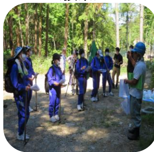
<緑化少年団入団式>