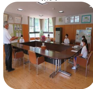
<生徒会役員認証式>