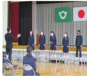
1年 (この星に生まれて)