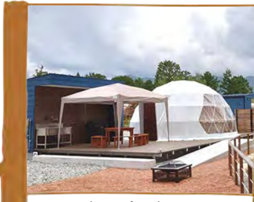
グランピングエリア 約30㎡のドーム型テント 6区画中2区画はペット同伴可

グランピングとは、グラマラス（魅力的な）とキャンプを組み合わせた言葉で、テントやキャンプ道具等を用意しなくても気軽にキャンプ体験を楽しめ、ホテル並みの快適なサービスも受けられる、新しいキャンプスタイルです。