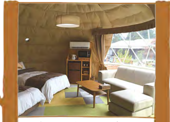
中はベッド、ソファがあり テレビ、冷蔵庫も完備

GRAN PEAKS HIGASHISHIRAKAWA OUTDOOR RESORT