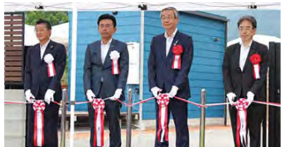
令和4年7月 オープンセレモニーでのテープカット