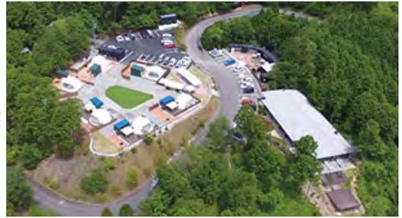
令和4年 こもれびの里一帯

グランピングとは、グラマラス（魅力的な）とキャンプを組み合わせた言葉で、テントやキャンプ道具等を用意しなくても気軽にキャンプ体験を楽しめ、ホテル並みの快適なサービスも受けられる、新しいキャンプスタイルです。