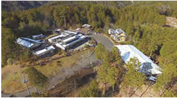
平成29年 こもれびの里一帯

こもれびの里一帯、計16000㎡に村の豊かな自然と星空を満喫できる、キャンプ施設が完成しました。