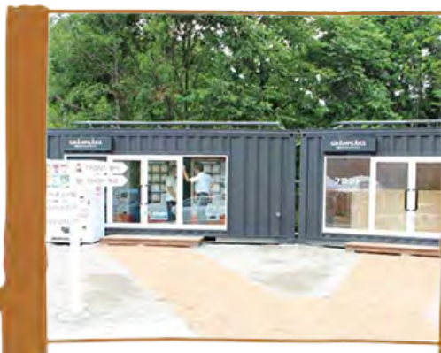
フロント フロント横には東白川の冷凍鮎の自販機も

GRAN PEAKS HIGASHISHIRAKAWA OUTDOOR RESORT