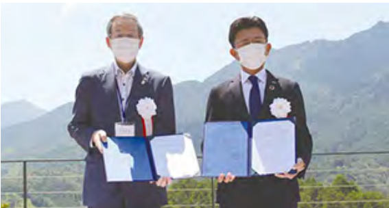
令和3年6月 地域活性化を目的とした協定調印式

「こもれびの里」は令和元年度、体験関連で約3千人、レストランは1万2千人あった利用は、コロナウイルス感染症の影響で激減し、運営のあり方を検討していました。それまでに、縁が深まっていたエネテックホールディングスが「クローチェ」の2号店出店を計画、協定書により令和3年2月こもれびの里内の「レストラン味彩」を活用した、クローチェ シーズン2 をオープンする運びとなりました。6月のオープンの際、「こもれびの里一帯の利活用に関する協定書」をクラウドナインマーケットと締結しました。