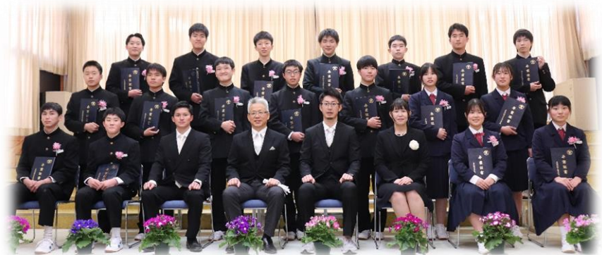
【卒業式後の集合写真】

うららかな春を思わせた3月7日、在校生が心を込めて設営した会場にて、厳粛に卒業証書授与式を執り行うことができ、18名の卒業生が、笑顔いっぱいであつ立っていました。これまで支えていただきました地域の方々、ご家族の皆様方に、職員を代表しまして感謝申し上げます。