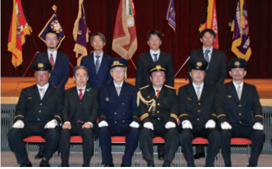
東白川村消防団入退団式（3月12日） （はなのき会館）