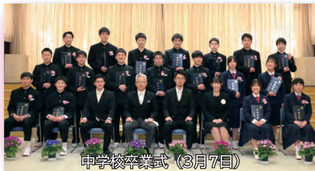
中学校卒業式 (3月7日)