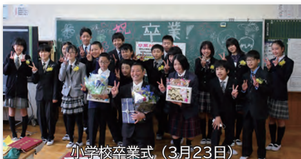
小学校卒業式 (3月23日)