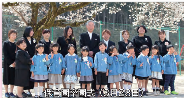
保育園卒園式 (3月28日)