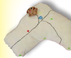
「デニムのぼうけんクッション」