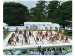
大関ヶ原祭2022東西人間将棋の様子

著名歴史家によるトーク、例年大人気の東西人間将棋や東西対決花いけバトル、東西グルメ対決などに加え、関ヶ原合戦祭りと同時間開催となり、豪華な催しが目白押しです。