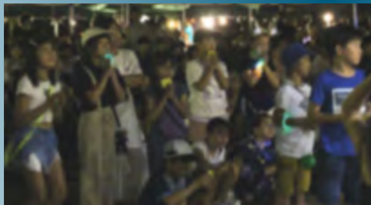
↑抽選会の半券を握りしめ当選を心待ちにしている子供たち