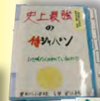
「史上最強の侍ジャパン」