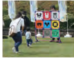
ぎふ清流レクリエーションフェスティバル2022の様子

子どもからお年寄りまで、誰でも気軽に楽しむことができるイベントです。県内5会場で開催するレクリエーション体験イベント「ミナレク広場」では、どなたでも自由に参加できるレクリエーションの体験コーナーやステージイベントなどを実施しますので、ぜひご来場ください。