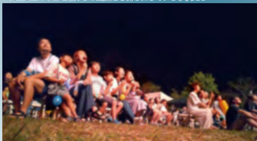
↑花火によって彩られた夜空を見上げる観客

会場には祭りを楽しむ人や久しぶりに会う人との再会で喜びの笑顔があふれていました。商工会青年部や団体・企業等、夏祭りの開催を願う多くの人の力や思いによって、子供たちをはじめ、来場した人たちの記憶に残る夏祭りとなりました。