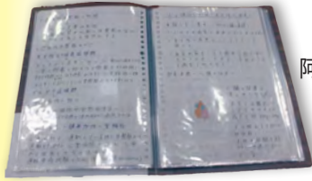
「AED・人の仕組みについて」