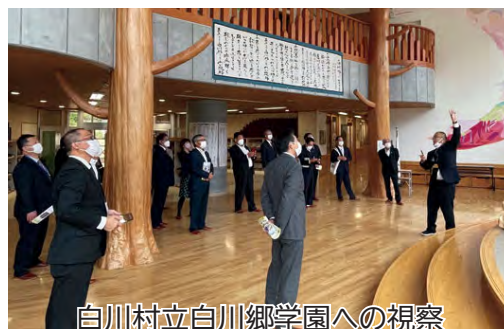
白川村立白川郷学園への視察

開校を検討する上で、校舎の選定が重要であり新築であれば多額の費用が発生します。委員会では小・中学校のどちらかの校舎を改修移行することで費用負担を最小限に抑えることとしました。2つの校舎を比べ、①施設規模が大きい、②教室数に余裕がある、③運動場や体育館の広さに問題がない、④増築の可能性が低い等の点から小学校を義務教育学校の校舎として利用する方向で答申しました。