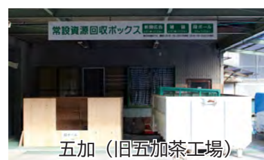
五加 (旧五加茶工場)