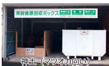
神戸 (マツオカ向い)