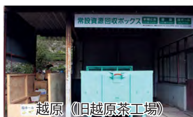
越原 (旧越原茶工場)