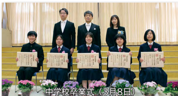
中学校卒業式（3月8日）

保育園卒園式と小中学校卒業式が行われました。先生や友達とのかけがえのない思い出が詰まった学び舎を巣立ちました。式ではこれまでの思い出の振り返りや合唱を響かせました。感謝と別れの寂しさを胸に新たな旅立ちへ歩みを進めました。