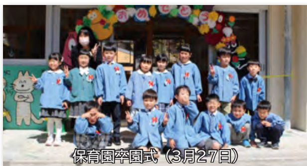
保育園卒園式（3月27日）