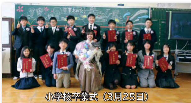
小学校卒業式（3月25日）