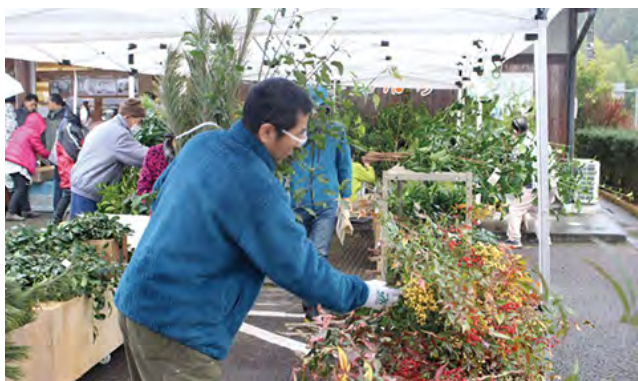
そよごや松など迎春用品を確認

年末の伝統行事、お松さま祭りが茶の里野菜村駐車場で開催されました。会場に並んだ迎春用品は村の職人が丹精込めて作った物で、神事によるお清めのあと販売が行われました。販売される迎春用品を求めて、村内及び近隣市町から約50名が列を作り、販売が始まると一斉に購入しました。あいにくの雨となりましたが、会場で無料配布された豚汁を片手に来場者は温まりながら知り合いと談笑し、新年を迎える準備を行いました。