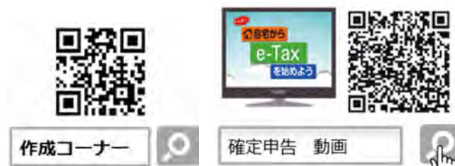
確定申告書等作成コーナー

「国税庁 LINE 公式アカウント」では、受け取りたい情報を事前に受信設定することで、「確定申告が必要な方」、「医療費控除」、「ふるさと納税」などのご自身のニーズに合った情報をタイムリーに受け取ることができますので、是非、『友だち追加』をお願いします。