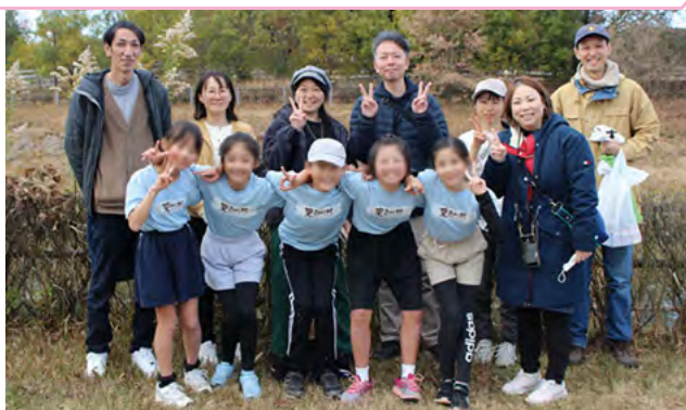
初出場の小学生「チーム友達」とその保護者

児童は「走って気持ちよかった」「バトンを繋いでゴールできて良かった」と話しました。