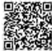
国税庁 LINE 公式アカウント