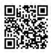
献血バス運行 スケジュール