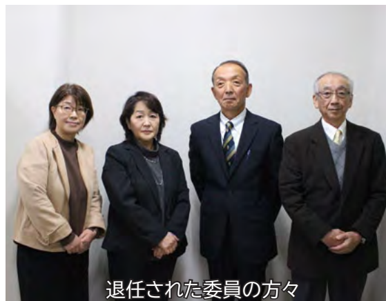
退任された委員の方々