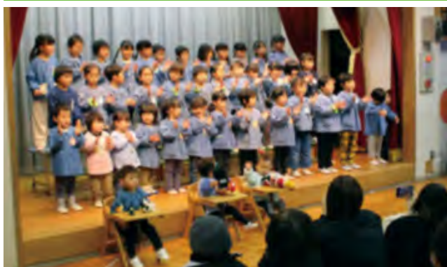
全園児による歌披露

保育園でおゆうぎ会が行われ、未満児から年長児が歌や踊り、劇など10の演目を披露しました。園児たちは11月からそれぞれの組で練習を重ね、手作りの小道具やおそろいの衣装で発表に臨みました。緊張した面持ちで始まった会でしたが、それぞれの劇や歌を発表するうちに声は大きくなり、笑顔で溢れました。演技を見た保護者は「どの子もかわいかった」「家でも練習してたが、とても上手に出来たと思います」と話しました。