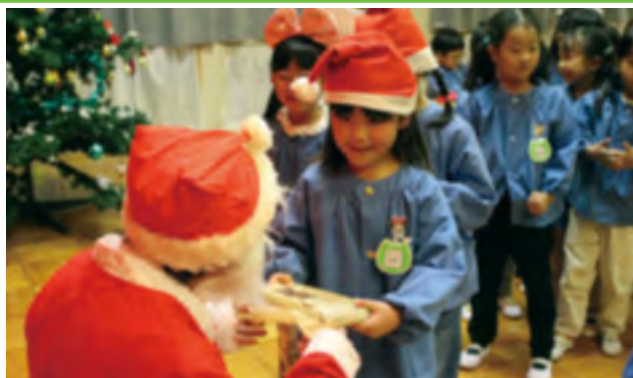
サンタからプレゼントを受け取る園児

保育園でクリスマス会が行われました。園児はサンタやトナカイに見立てた手作りの帽子やカチューシャをかぶり、遊戯室に集まりました。会の途中にはサンタクロースが登場し、サンタから手渡しでプレゼントを受取りました。その後、クラスごとに歌を披露したり、おゆうぎ会で行ったダンスをみんなで踊るなどして楽しみました。その後は、全員で給食を食べ、友達と過ごすクリスマスを終始笑顔で楽しみました。