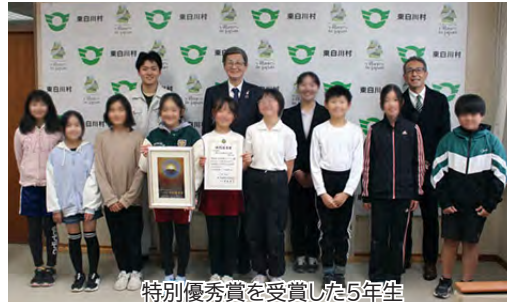
特別優秀賞を受賞した5年生

12月6日・7日に茨城県で開催された「第27回 米・食味分析鑑定コンクール：国際大会」で、5年生が作った米が特別優秀賞を受賞し、児童が直接村長に報告しました。今年総合学習の授業で作ったお米は田代ライス指導のもと育て、例年の2倍以上収穫することが出来ました。コンクールは長野県や福島県、佐賀県など47校の小学校から応募があり、お米の成分分析と試食の結果、特別優秀賞の受賞となりました。児童は「お米作りは楽しく、賞が貰えてうれしかった」と村長に話しました。