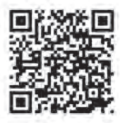
厚生労働省 キャンペーン紹介

令和8年のキャンペーンキャッチフレーズ 「誰かの今をつないでいく。はたちの献血」 期間：1月1日（木）～2月28日（土）