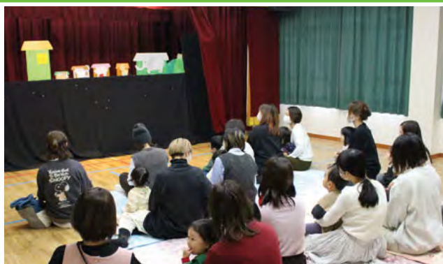
人形劇を観賞する親子

2歳以下の親子の交流の場、ひよこくらぶのお楽しみ会が越原センターで行われました。この日は、サークル「かくれんぼ」による人形劇が行われ、「ぞうくんのさんぽ」の劇や手遊びの歌、マジックなどを親子で楽しみました。子供たちは歌ったり、見よう見まねで手を動かしたり、絵本とは違った劇のワクワクや臨場感に釘付けになっていました。また、サンタクロースがサプライズで登場するなど楽しい会となりました。