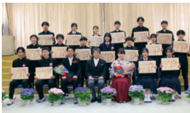
3月6日（金）中学校卒業式

みつば保育園卒園児 12名 東白川小学校卒業生 12名 東白川中学校卒業生 17名