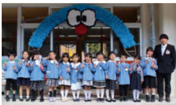
3月27日（金）保育園卒園式