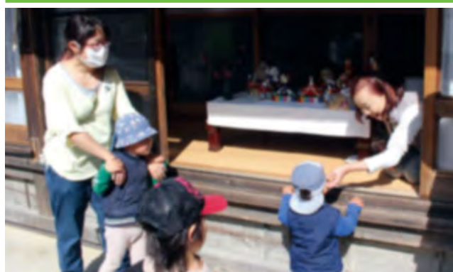
ひな人形を見て、お菓子をもらう子ども

五加地内で「がんどうち」が行われ、小学生以下の子ども達が各家庭を訪問しました。がんどうちとは、飛騨地方で広く行われているひな祭りの行事で、子ども達が各家庭を回り、ひな人形を見て歩くものです。村内では五加地区のみで行われており、訪れた子ども達にはお菓子が配られます。それぞれの家庭でお菓子を受取った子ども達は、袋いっぱいのお菓みに笑顔を見せていました。