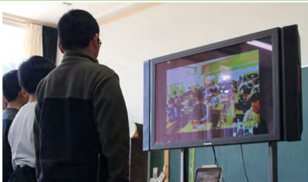
リモートで質問に答える児童

小学4年生が今渡南小学校と映像を繋いで交流授業を実施しました。山間部と都市部の暮らしの違いを学んだことをきっかけに実現したもので、東白川小の児童は1クラスに3～4人の外国人が在籍する学校の生活について、普段使う言語や交流方法などを質問しました。一方、今渡南小の児童は、給食の内容や学校で見つける生き物について質問をし、学校生活の違いに驚きの声を上げ、互いの地域の特色について学び合いました。