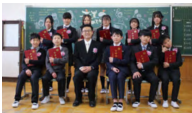
3月25日（水）小学校卒業式