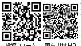
投稿フォーム 東白川村 HP

つちのこフェスタに合わせて、5月号につちのこのイラストを掲載します。あなたが描いたイラストを広報紙に掲載してみませんか。右のQRコードから写真・イラストを投稿することが出来ます。その他の投稿方法については、東白川村 HP をご確認ください。